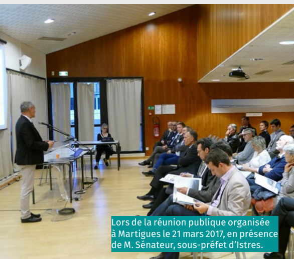
Lors de la réunion publique organisée à Martigues le 21 mars 2017, en présence de M. Sénateur, sous-préfet d'Istres.

Entre le 20 mars et le 21 avril derniers, EDF EN et RTE proposaient un moment de partage supplémentaire autour du projet Provence Grand Large : la concertation préalable au dépôt des demandes d'autorisation. Il s'agissait d'informer des évolutions apportées au projet depuis 2015, de répondre aux questions des participants mais aussi de recueillir leurs points d'attention. L'objectif : les intégrer avant de déposer les demandes d'autorisation.