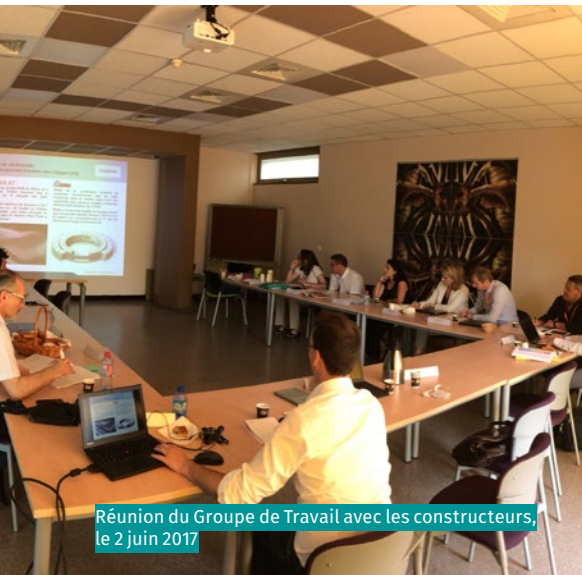
Réunion du Groupe de Travail avec les constructeurs, le 2 juin 2017

Le 2 juin dernier, l'équipe projet a proposé une réunion de travail aux représentants de l'économie locale : la CCI Marseille Provence, la Région, l'Agence régionale pour l'innovation et l'internationalisation des entreprises en PACA, le Pôle Mer Méditerranée, Cap Energies, la Métropole Aix-Marseille (Territoires de Martigues et d'Istres Ouest Provence). Ils ont rencontré les constructeurs des futurs flotteurs et éoliennes (SBM Offshore et Siemens). Le détail des appels d'offres à venir et les planning de travaux ont été partagés. La rencontre a permis de discuter d'une feuille de route à déployer pour favoriser la participation de l'écosystème régional à ces futures consultations. De l'avis général, de nombreux acteurs régionaux pourraient se porter candidats et consolider ou diversifier leur activité : au delà du projet Provence Grand Large, l'éolien flottant a vocation à se développer au niveau mondial, et donc être une source potentielle d'exportation pour les entreprises de la région qui auront pu être sélectionnées.